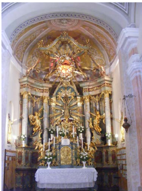
2. ábra: Az osli templom szentélye a kegyképpel

Osli a 14. század végétől ismert kegyhely, a 18. századtól, az új templom, és a - hagyomány szerint az Esterházy hercegtől kapott - kegyszobor ottlététől a búcsújárás még erősebbé vált.